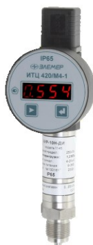
АИР-10L-ДА, АИР-10Н-ДД АИР-10L-ДИ, АИР-10Н-ДА, АИР-10Н-ДИ, АИР-10Н-ДИВ