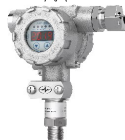
АИР-10SH-ДА, АИР-10SH-ДИ, АИР-10SH-ДИВ