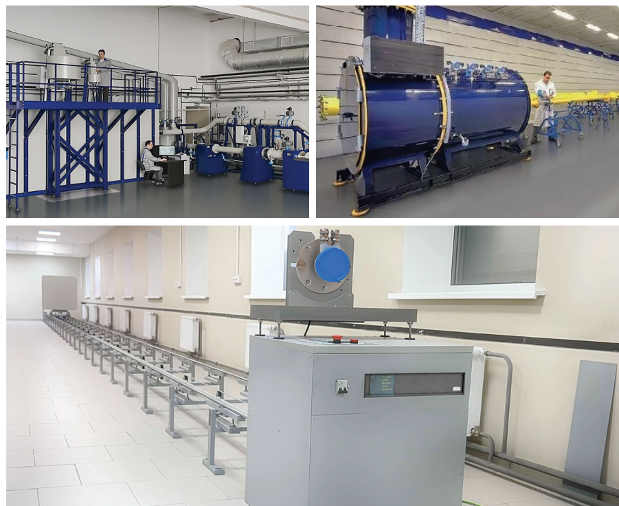
Рис. 3. Поверка расходомеров и уровнемеров

Имея мощную производственную базу, метрологическую лабораторию и высококлассных специалистов-метрологов, НПП «ЭЛЕМЕР» остается открытым для своих партнеров, предоставляя заказчикам все возможности, связанные с самостоятельным выполнением ими ремонта продукции производства НПП «ЭЛЕМЕР». Для этого организовано бесплатное обучение технических специалистов заин-