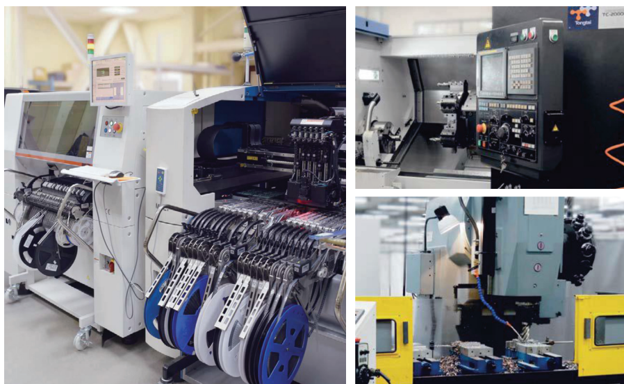
Рис. 2. Автоматизированная линия по установке и пайке компонентов и высокотехнологичные обрабатывающие центры

плексы, эталонные преобразователи давления и т. д.), а также арматуру для датчиков давления и температуры.