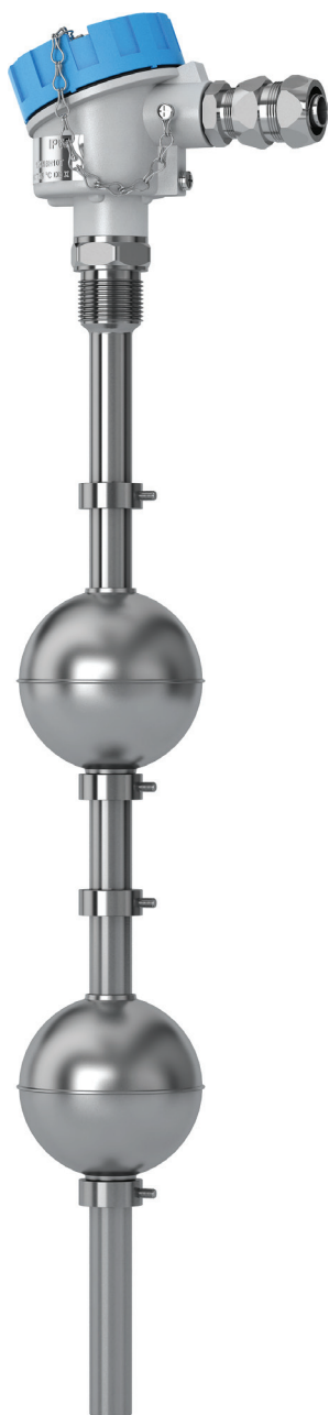
Рис. 2. Поплавковый потенциометрический уровнемер «ЭЛЕМЕР-УПП-11»

ными «ЭЛЕМЕР-СВ-11», контролирующими не только различные жидкие среды, но и сыпучие материалы любой плотности.