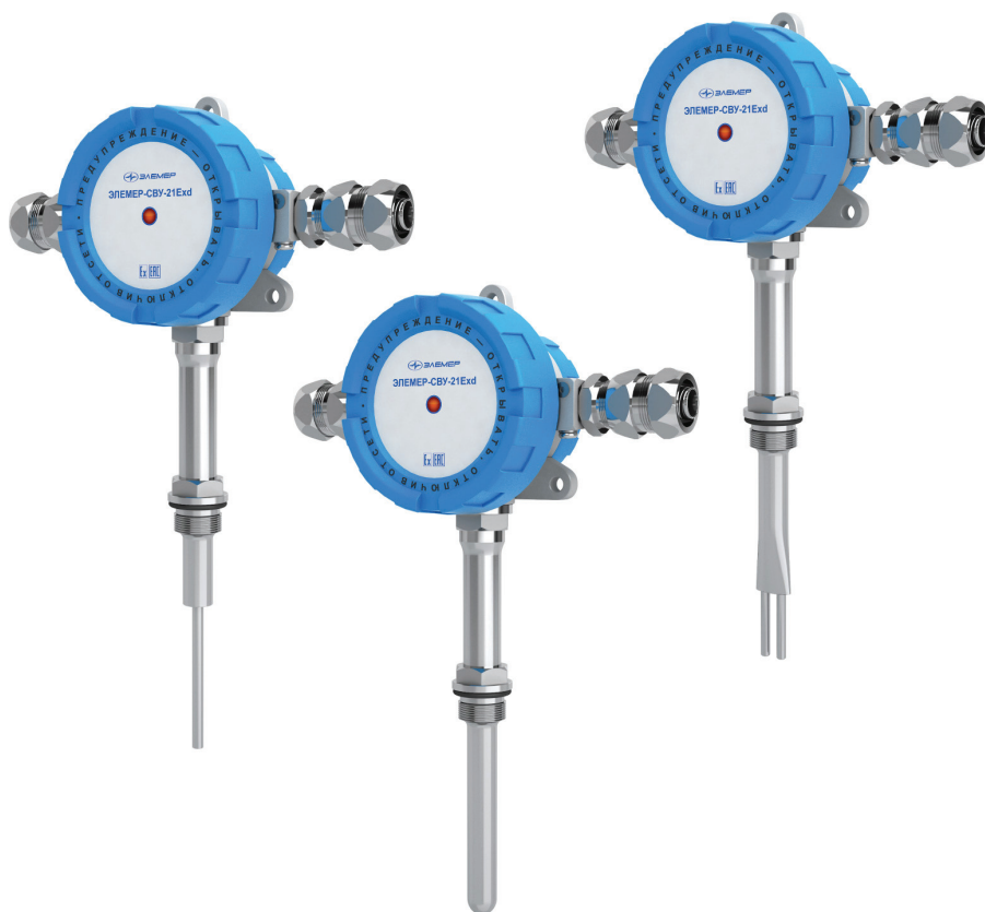
Рис. 3. Ультразвуковые волноводные сигнализаторы уровня и потока «ЭЛЕМЕР-СВУ-21»

Гибкость предприятия в вопросе разработки и модернизации приборов позволяет оперативно реагировать на требования рынка и заказчиков. Это можно видеть на примере оборудования, реализованного по запросу ПАО «Сургутнефтегаз», партнера компании «ЭЛЕМЕР». Рассмотрев заявленные технические требования на сигнализаторы уровня жидких сред