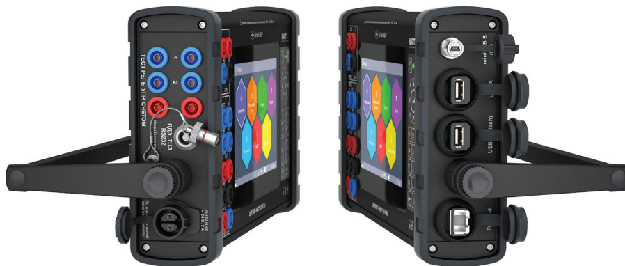
Рис. 3. Боковые панели

На задней панели помещена табличка (рис. 2) с заводским номером изделия и датой его выпуска, а также маркировкой наличия/отсутствия взрывозащиты, степени защиты