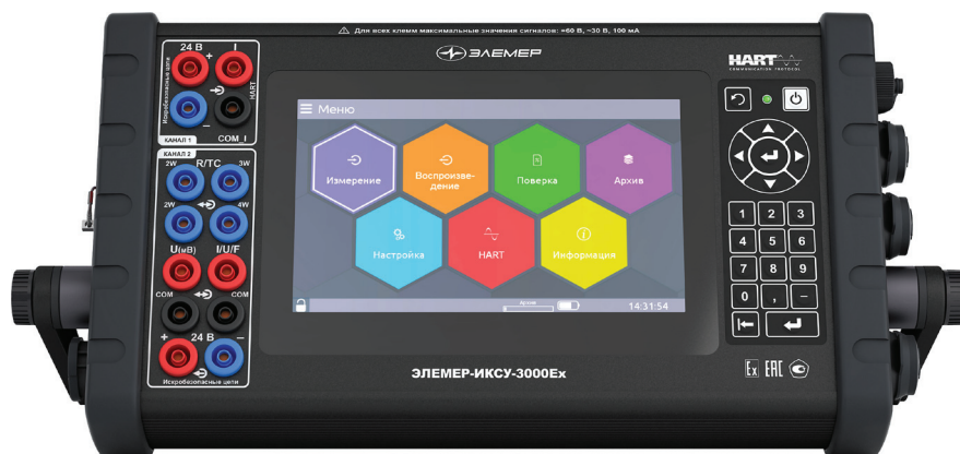
Рис. 1. Эталонный калибратор-измеритель унифицированных сигналов ИКСУ-3000: лицевая панель

Прибор соответствует рабочему эталону первого разряда единицы силы постоянного электрического тока, третьего разряда единицы постоянного напряжения и четвертого разряда единицы электрического сопротивления.