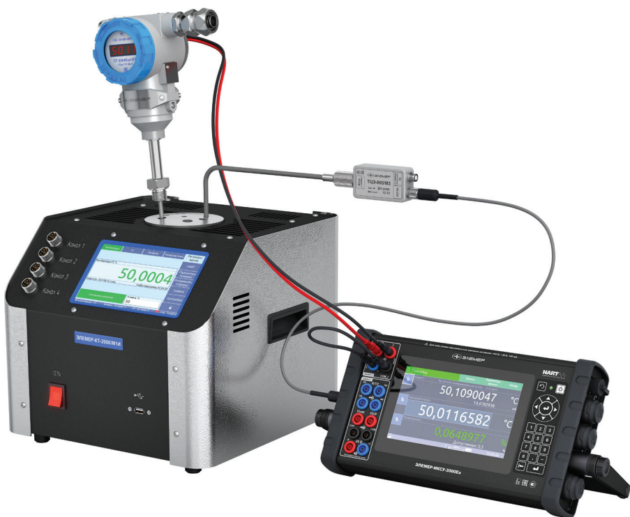
Рис. 6 ЭЛЕМЕР-ИКСУ-3000 с калибратором температуры: проверка термопреобразователя