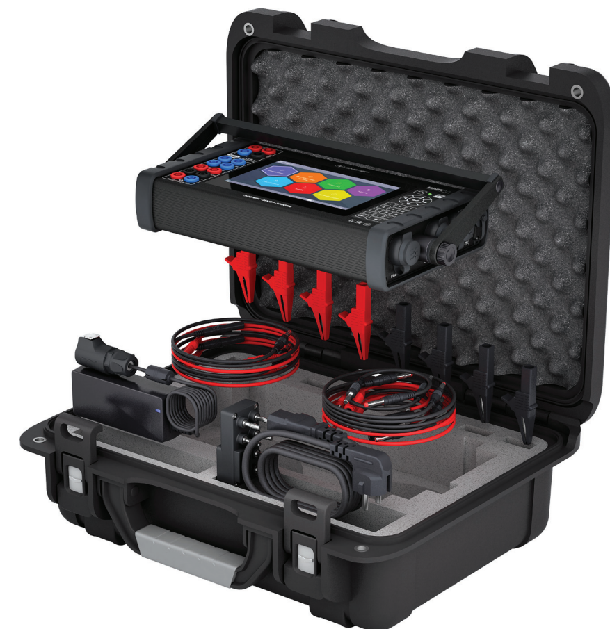
Рис. 8. Комплект ЭЛЕМЕР-ИКСУ-3000

стройке нормирующего преобразователя, HART и 1-Wire.