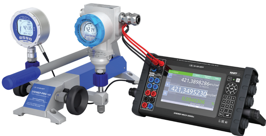
Рис. 7. Проверка датчиков давления