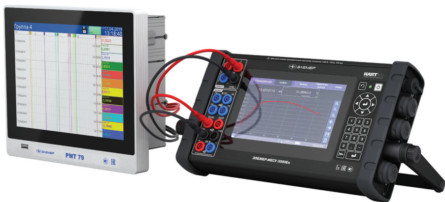
Рис. 5. ЭЛЕМЕР-ИКСУ-3000 с видеографическим многоканальным регистратором PMT 79

осуществляет регистрацию поступающей по двум измерительным каналам информации в течение заданного интервала времени, при этом в устройстве заложена возможность сохранения накопленных данных на внешний носитель информации, например съемный USB-накопитель.