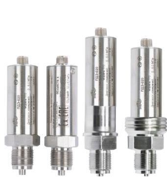
Рисунок 1 – Внешний вид преобразователей ПДЭ-020