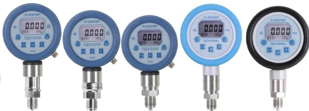
Рисунок 2 – Внешний вид преобразователей ПДЭ-020И