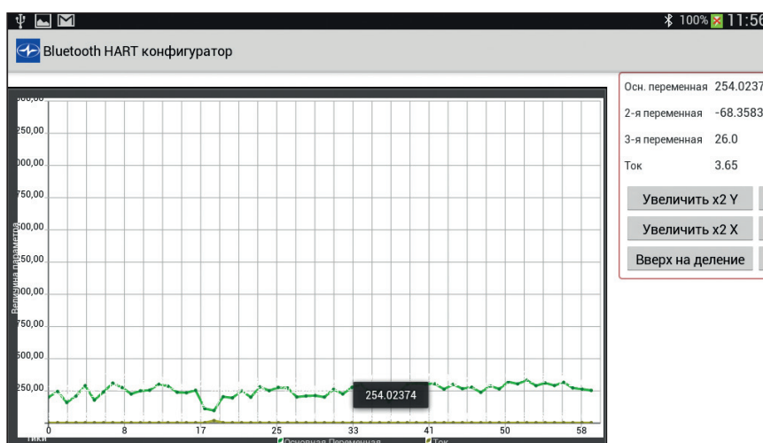
Закладка «Монитор». Вывод данных в виде графика

Мы искренне надеемся, что программное обеспечение «Bluetooth HART конфигуратор» сделает Вашу работу удобной и поможет осуществлять оперативное тестирование устройств с HART-протоколом, настройку и подстройку важных параметров в любом месте, в том числе непосредственно на участке технологического процесса. Мы уверены, что новый программный продукт будет полезен и станет важной составляющей Вашей работы!