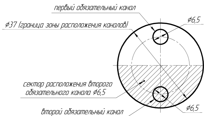
Рисунок А.2 Нестандартный набор каналов.*